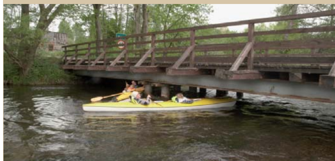
Pierwszy most za Wojtałem