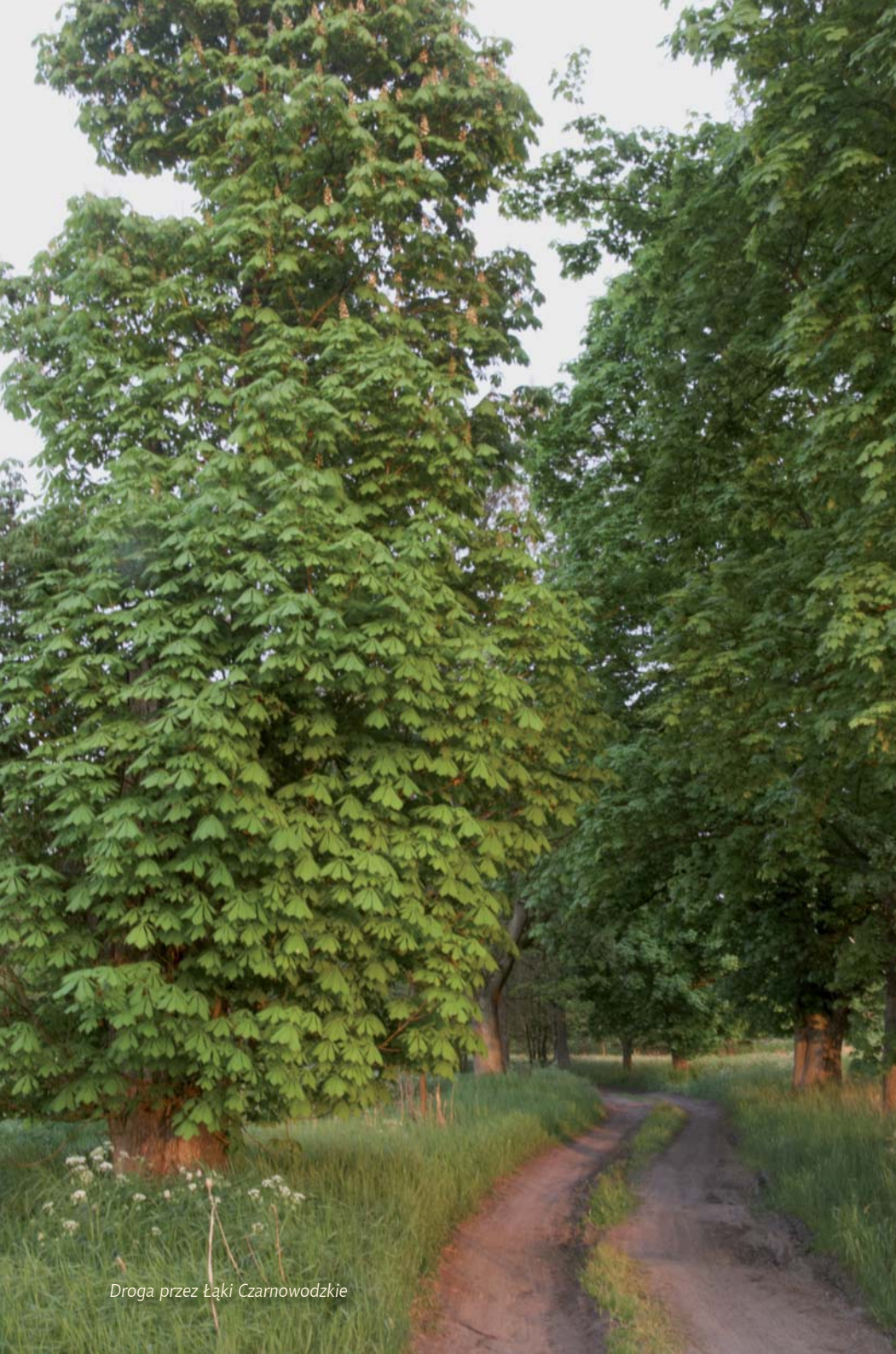
Droga przez Łąki Czarnowodzkie

Miłośnikom przyrody wystarczy przechadzka o świcie i nie tylko, po okolicznych lasach, aby natknąć się na, wyglądających dość osobliwie w naszym stuleciu, jelenia, czy borsuka.