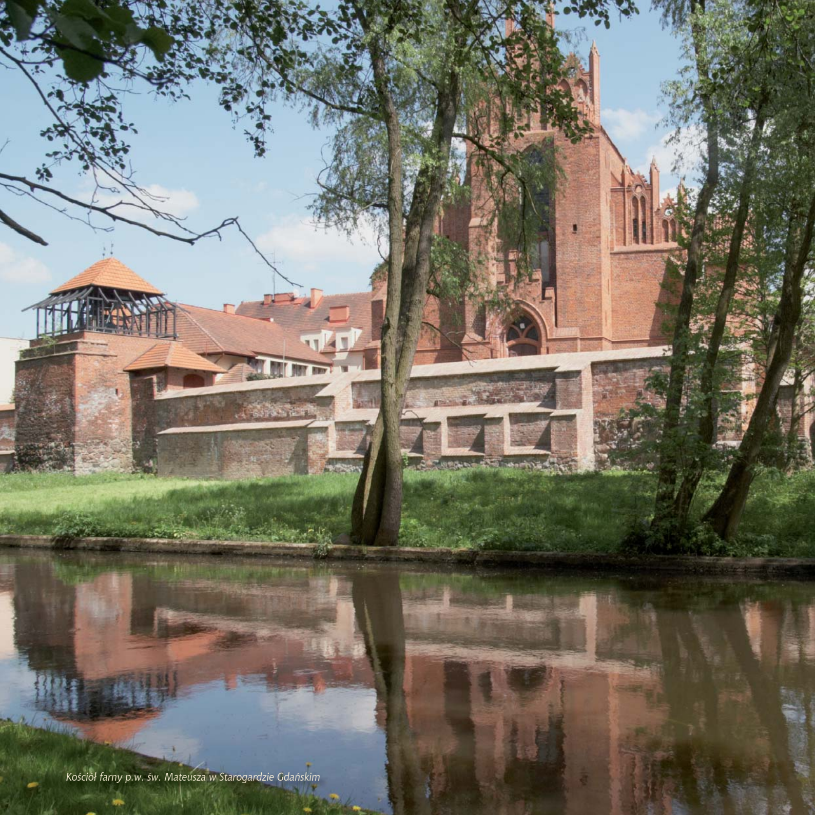
Kościół farny p.w. św. Mateusza w Starogardzie Gdańskim