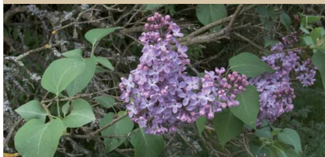
Bzy na szlaku w Urozy