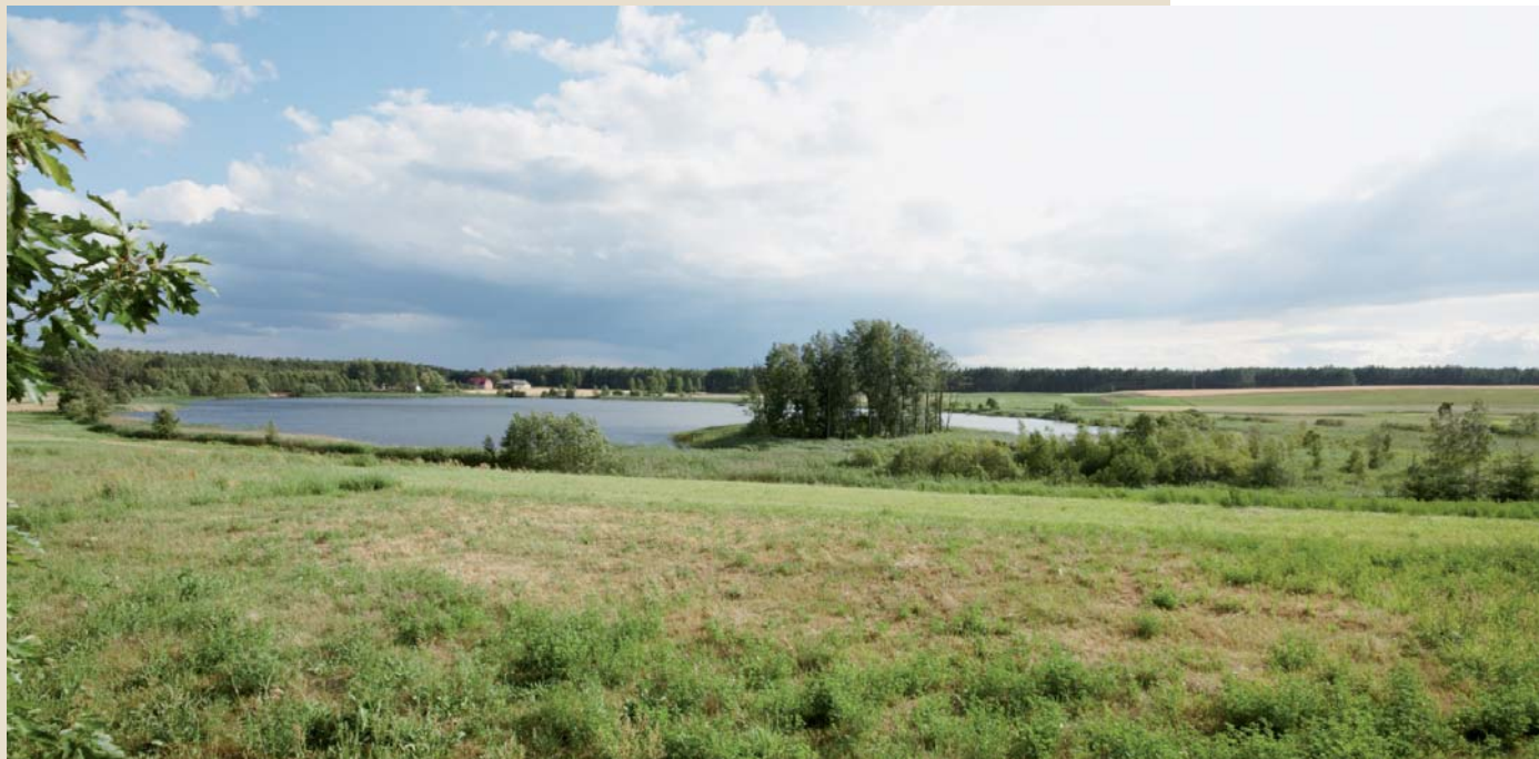
Pola i jezioro pod Lubikami