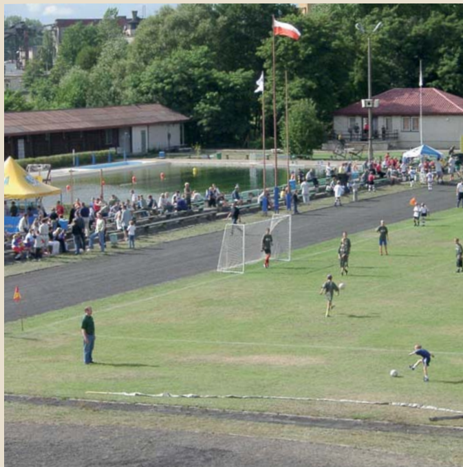
Turniej Drużyn Podwórkowych