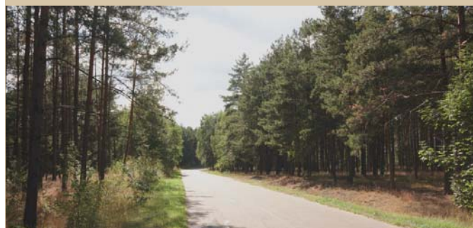
Szoza w lesie