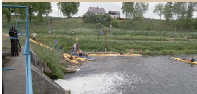
Przystań Wojtal koło Odr