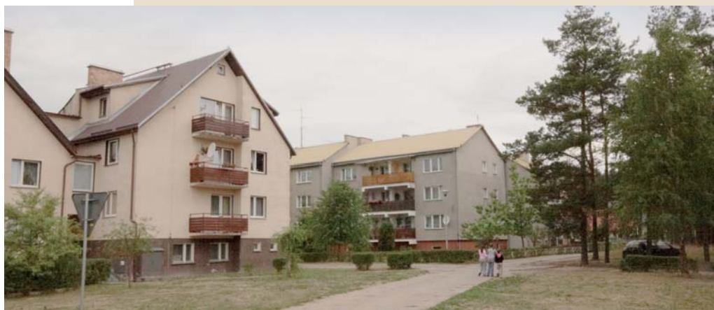
Osiedle Słowackiego w Czarnej Wodzie