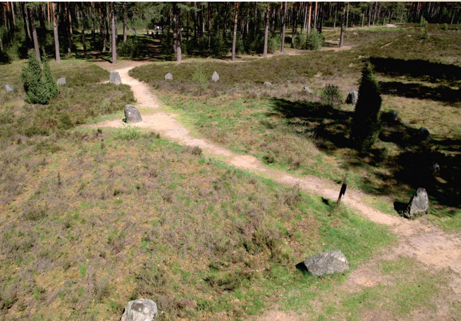
Kamienne Kręgi w Odrach

Wielbiciele wędrowek znajdą tu piesze szlaki turystyczne, z których jeden prowadzi przez Bory Tucholskie do stolicy regionu Starogardu Gdańskiego i do Tczewa, drugi wiedzie do Odrów słynących z Kamiennych Kręgów. Owe kamienne kręgi, są legendarne ze względu na niezwykłą siłę stworzoną przez megalityczne pierścienie ułożone z różnej wielkości kamieni. Przypominają one o Gotach mieszkających na owych terenach w trzecim stuleciu naszej ery.