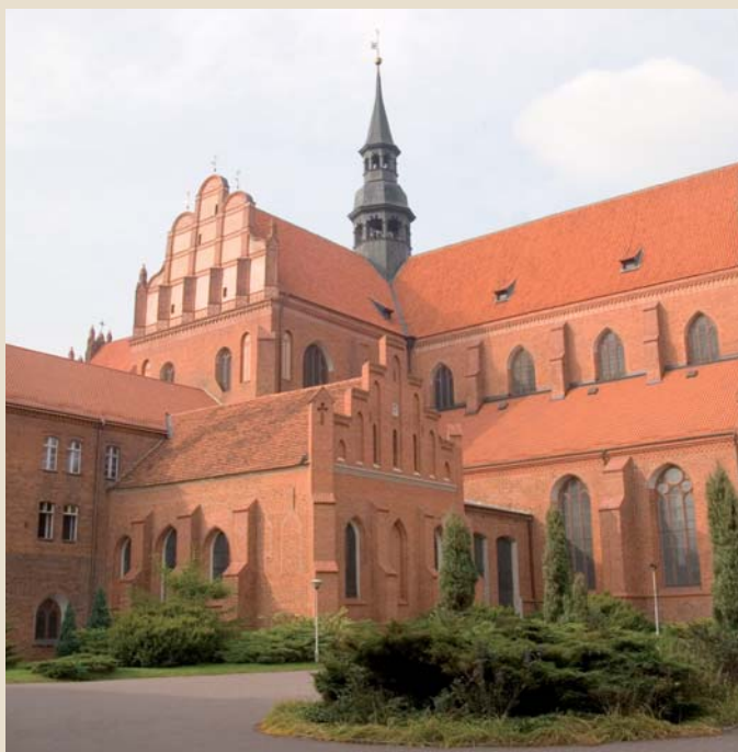
Bazylika Katedralna w Pelplinie