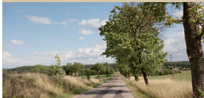
Droga z Lubik do Huty Kalnej