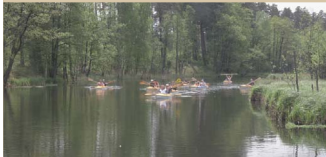
Spływ kajakami od strony Borska