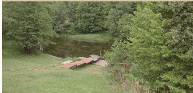
Jedna z przystani nad Wdą.

Opis: Szlak prowadzi z Czarnej Wody od Wystawy Przyrody Borów Tucholskich i Doliny Rzeki Wdy, przez punkt widokowy na rzekę Wdę w Zimnych Zdrojach, Lubiki, Hutę Kalną, Mały Bukowiec, Twardy Dół nad jeziorem Niedackim do Arboretum (o statusie Ogrodu Botanicznego) w Wirtach. Arboretum w Wirtach położone jest nad Jeziorem Borzechowskim Wielkim w gminie Zblewo. Zajmuje powierzchnię 33,61 ha, na której zgromadzono 620 gatunków drzew i krzewów. Jedną z atrakcji ogrodu są istniejące ścieżki: widokowa i dydaktyczna, które sprzyjają edukacji ekologicznej.