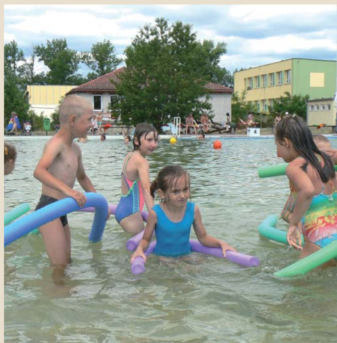
Letnia Szkoła Pływania