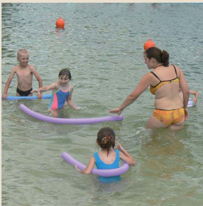
Nauka pływania na basenie w Czarnej Wodzie