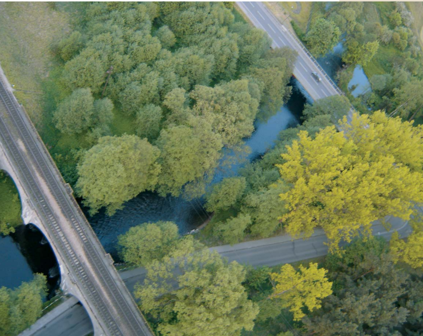
„Wielkie Skrzyżowania” w Czarnej Wodzie

Dzięki szlakom komunikacyjnym (droga krajowa nr 22 oraz trasa kolejowa Tczew-Piła) prosty jest dostęp do miasta i wielu jego atrakcji: