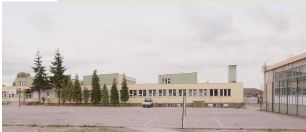
Zespół Szkół Publicznych w Czarnej Wodzie