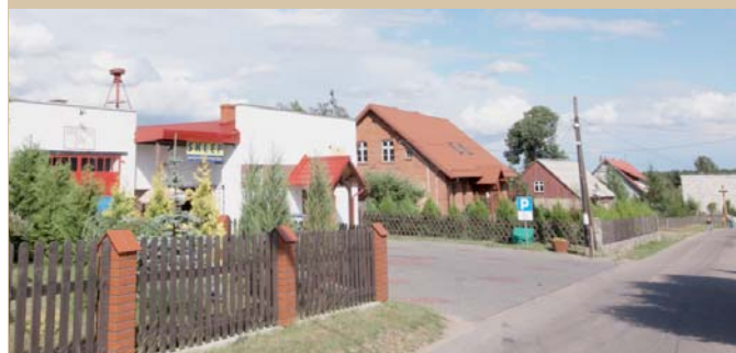
Świetlica Wiejska w Lubikach