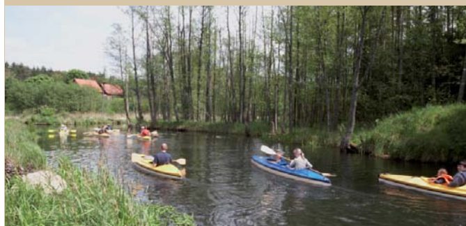
Spływ kajakami pod Urozą