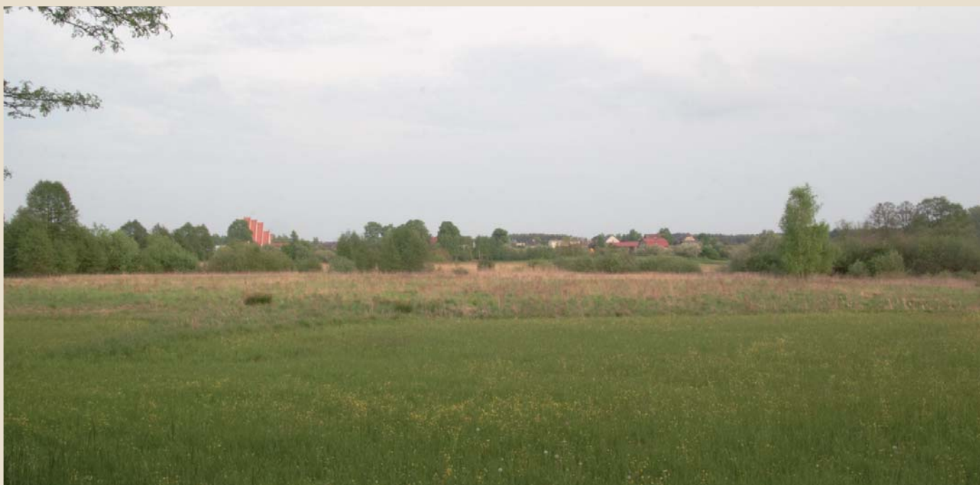
Panorama Czarnej Wody z widokiem na kościół i „utopioną „w zieleni „Berlinkę”