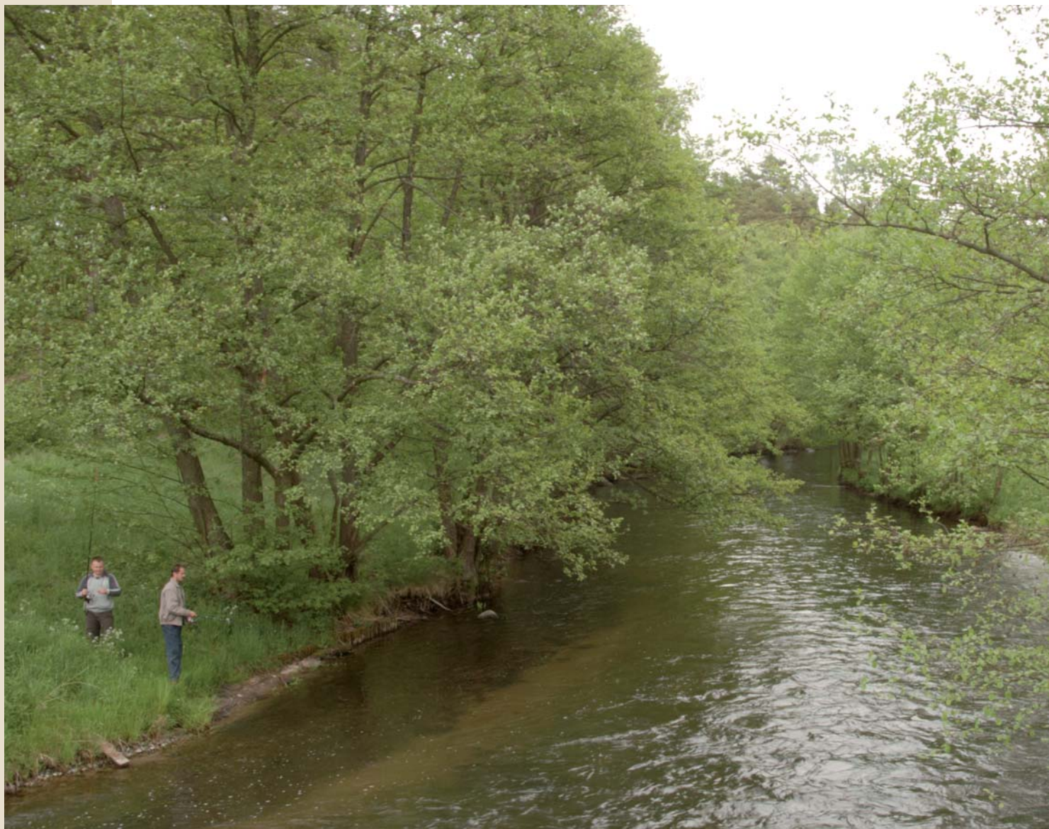
Wędkarze nad Wdą

Pasjonaci wędkarstwa z pewnością złowią pstrąga czy lipienia jeśli zahaczą tłustą muchę na swą wędkę.