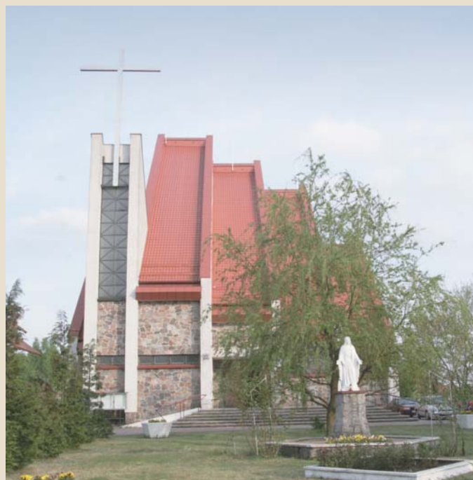
Kościół p.w. Matki Boskiej Częstochowskiej

Koło budynku leśniczówki zachował się ponad 300-letni okaz dębu.