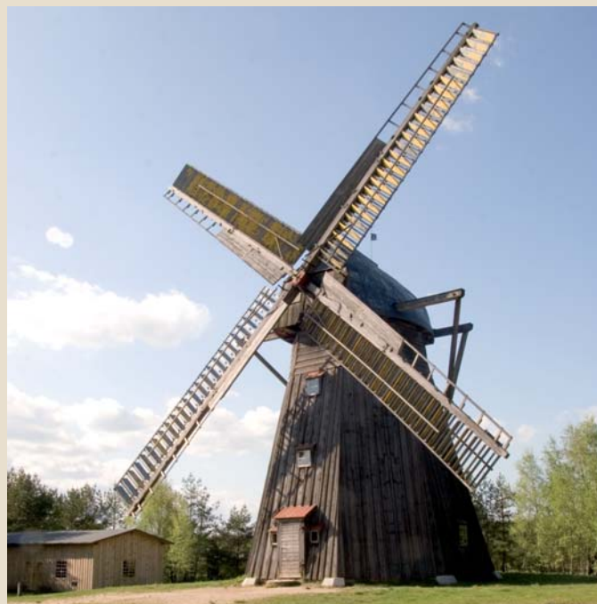
Wiatrak w Muzeum - Kaszubski Park Etnograficzny we Wdzydzach Kiszewskich

Lubiki - noclegi i agroturystyka - 6 km Huta Kalna - noclegi i agroturystyka - 8 km Kalwaria Wielewska - 25 km Pałac Wicherta w Starogardzie Gdańskim - 35 km Bazylika w Chojnicach - 40 km Bazylika Katedralna w Pelplinie - 44 km Ferma strusi Garczyn - 45 km Zamek w Gniewie - 52 km Centrum Wystawienniczo-Regionalne Dolnej Wisły w Tczewie - 58 km Wierzyca - Szymbark wieża obserwacyjna, najdłuższa deska, „dom na głowie” i inne - 60 km Zamek w Kwidzynie - 60 km Zamek w Malborku - Muzeum Zamkowe - 70 km Zamek we Świeciu - 80 km Gdańsk - stare miasto - 80 km Molo w Sopocie - 90 km