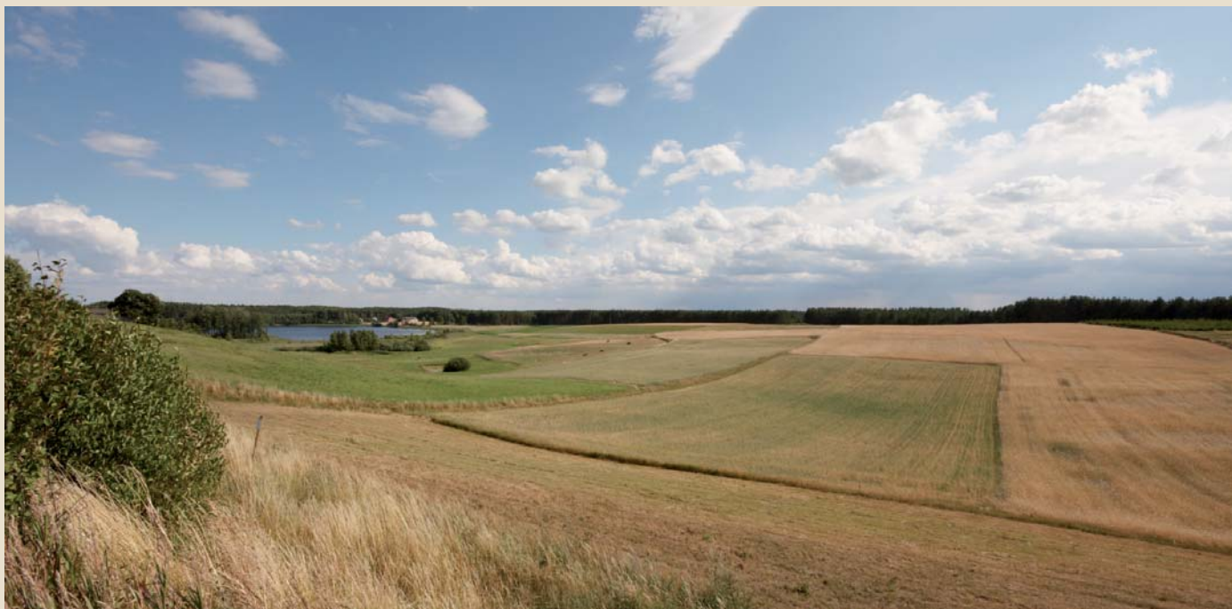
Pola i jezioro pod Lubikami