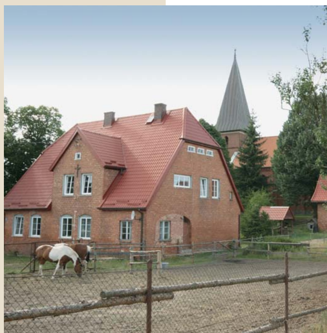
Kościół w Hucie Kalnej